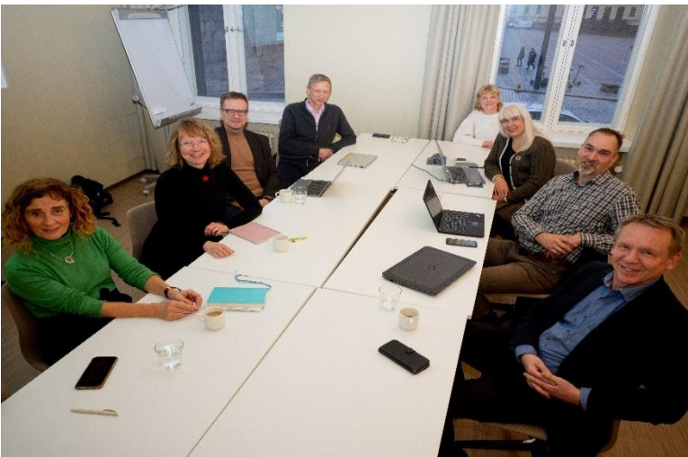
Kuva 1: Kestävyyspaneelin kokous 9.11.2022

Haluamme olla siellä, missä kestävydestä puhutaan. Toivomme, että ihmiset ovat yhteydessä meihin ja haastavat meitä kestäväen kehityksen asioissa.