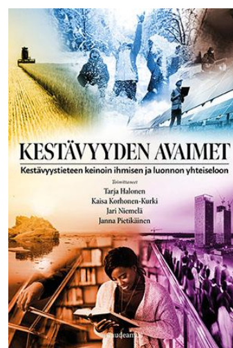
Kuva 4. Kestävyyden avaimet -kirja