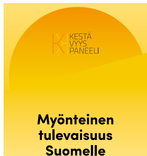
Kuva 2 Myönteinen tulevaisuus Suomelle -julkaisu

Julkaisu on käännetty myös englanniksi ja ruotsiksi. Sen julkaisutilaisuus järjestettiin 1.6.2022 Pikkuparlamentissa eduskunnan Tulevaisuusvaliokunnan kuulemisena.